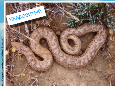
Песчаный удавчик ( Eryx miliaris (Brown phase) ) Длина до 70 см. Зрачок узкий вытянутый вертикально.