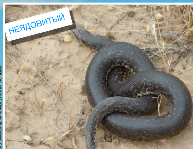
Песчаный удавчик ( Eryx miliaris (Black phase) ) Длина до 70 см. Зрачок узкий вытянутый вертикально.