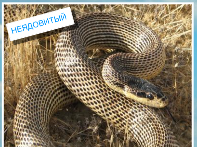
Четырехполосый полоз ( Elaphe sauromates ) Длина до 200 см. Зрачок имеет округлую форму.