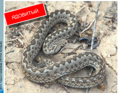
Степная гадюка ( Vipera ursinii renardi ) Длина до 60 см. Зрачок узкий вытянутый вертикально. Потенциально опасный, но редко встречаются серьезные последствия.