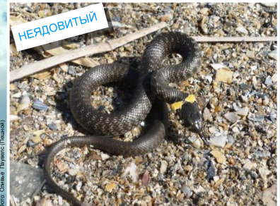
Обыкновенный уж ( Natrix natrix ) Длина до 130 см. Зрачок имеет округлую форму.