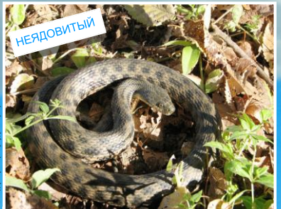
Водяной уж ( Natrix tessellata ) Длина до 140 см. Зрачок имеет округлую форму.