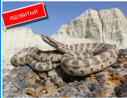
Обыкновенный щитомордник ( Gloydius halys caraganus ) Длина до 70 см. Зрачок узкий вытянутый вертикально. Потенциально опасный, укус вызывает сильные боли.