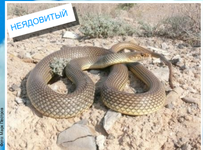
Желтобрюхий (каспийский) полоз ( Dolichophis caspius ) Длина до 200 см. Зрачок имеет округлую форму.